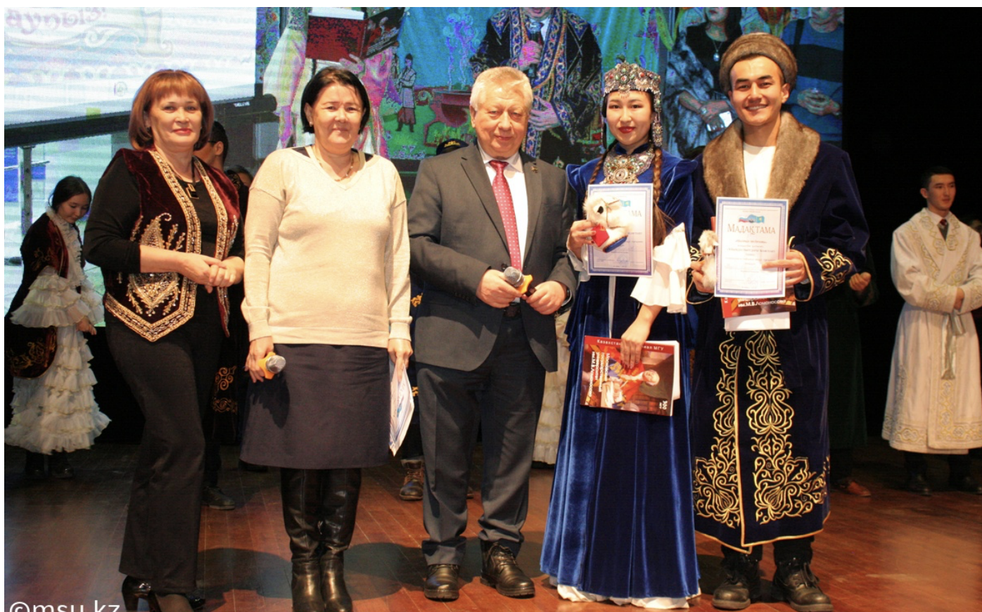
Проведение праздника «Наурыз-2018».