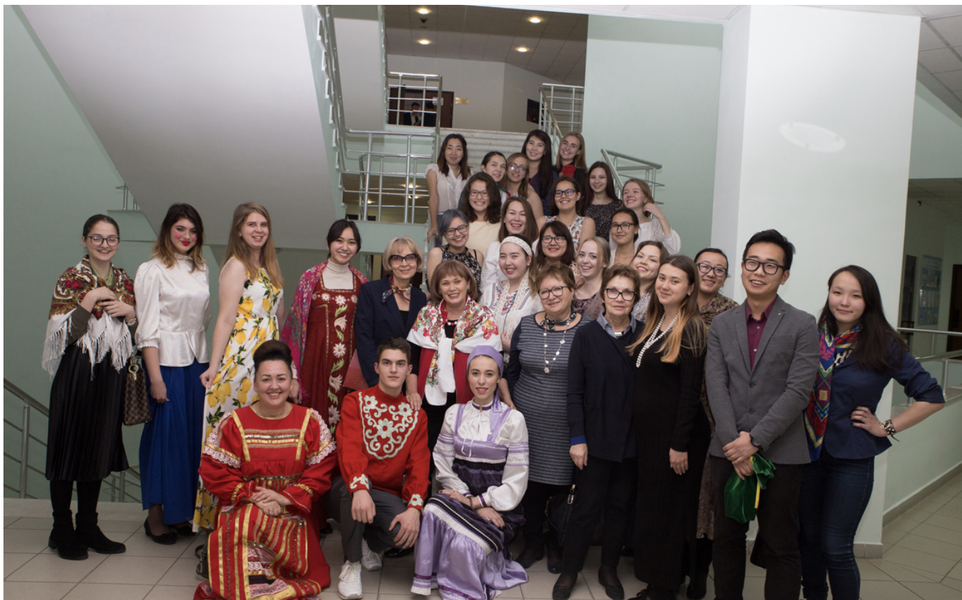
Отчетная конференция по фольклорной практике, 2017.