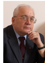
Ректор МГУ имени М. В. Ломоносова, Академик Садовничий В.А.

«Создание Казахстанского филиала Московского университета – важное событие в истории Московского университета, символизирующее дружбу народов России и Казахстана, наши тесные и неразрывные исторические, духовные, культурные, образовательные и научные связи»