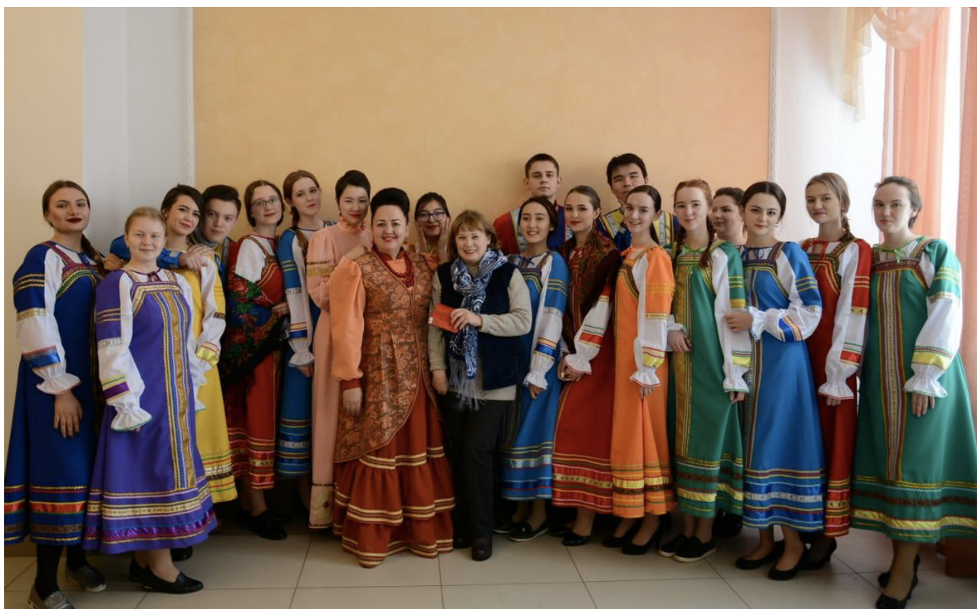
Фольклорно-студенческий ансамбль «Берегиня». Рождественское выступление в культурно-образовательном центре Успенского собора. Нур-Султан, 2019.