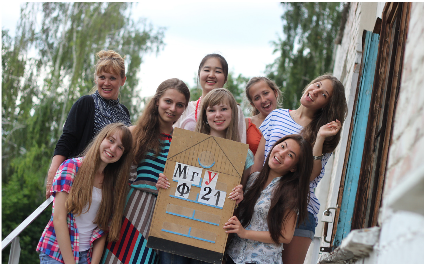
Фольклорная практика в Восточном Казахстане. Село Первороссийское, 2013.